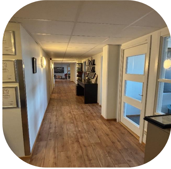
Korridor mot kök och konferensrum