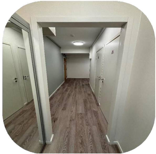
Korridor mot kök och toaletter