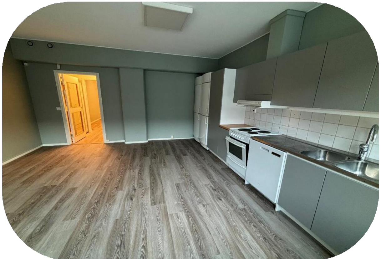
Kök med plats för matbord och stolar