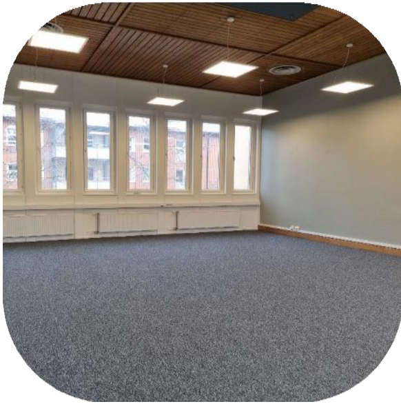
Kontorslokal med 5m takhöjd